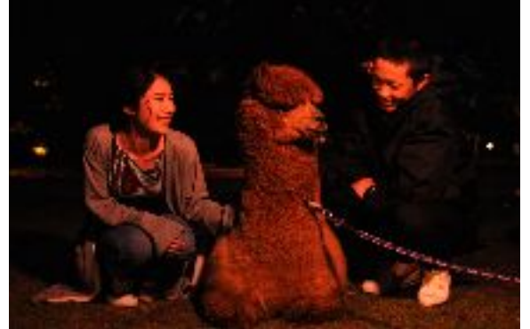
ナイトアニマルfeels (イメージ)