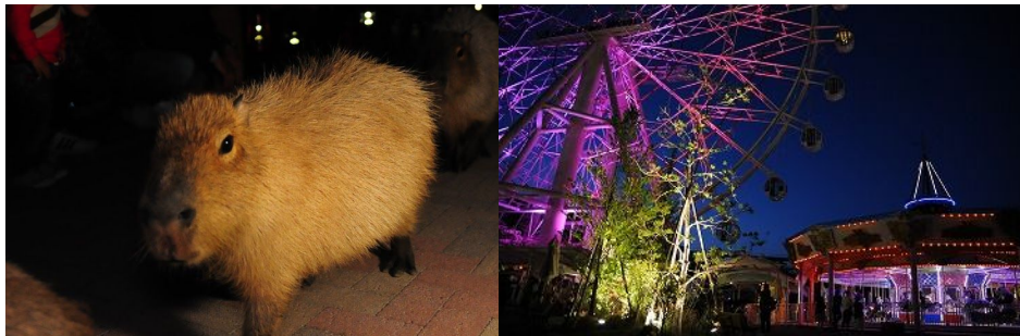
カピバラウォーキング